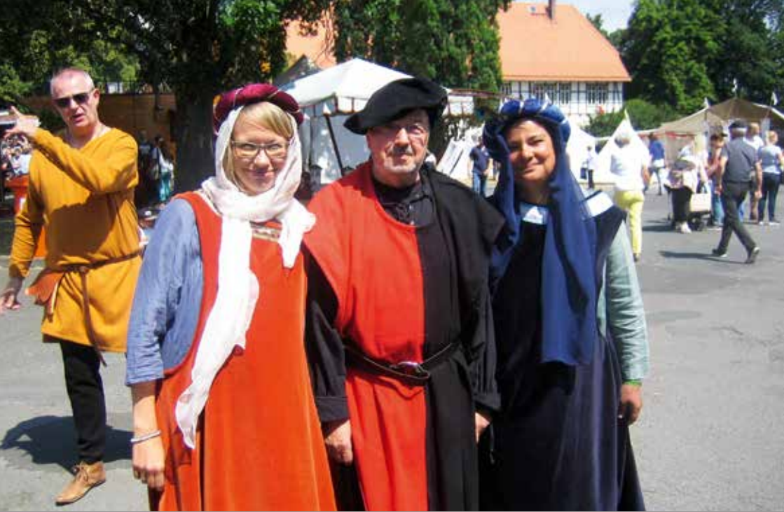
Gottesdienst anlässlich des Mittelaltermarktes auf dem Burghof am 8. Juli 2018