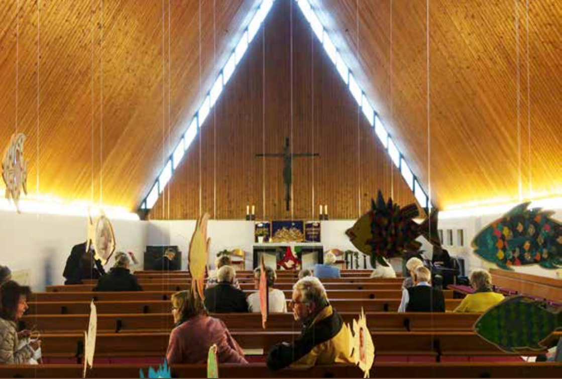
Fusionssonntag in Heilig-Kreuz