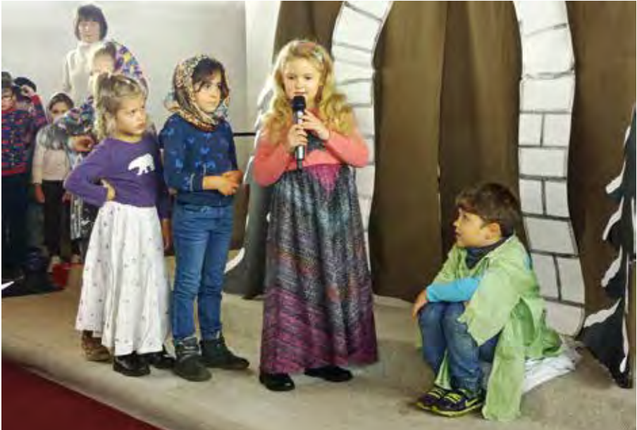
St. Martin in der Heilig-Kreuz-Kirche