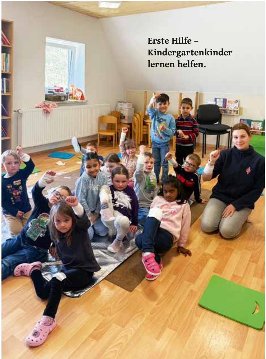
Erste Hilfe – Kindergartenkinder lernen helfen.