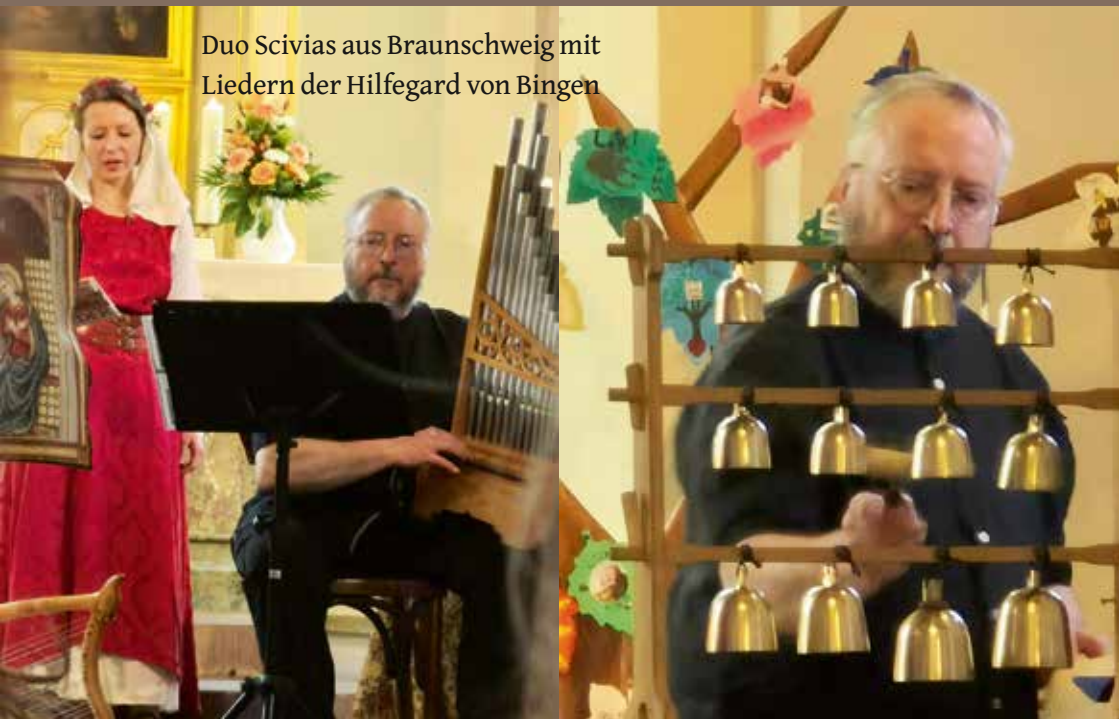
Duo Scivias aus Braunschweig mit Liedern der Hildegard von Bingen